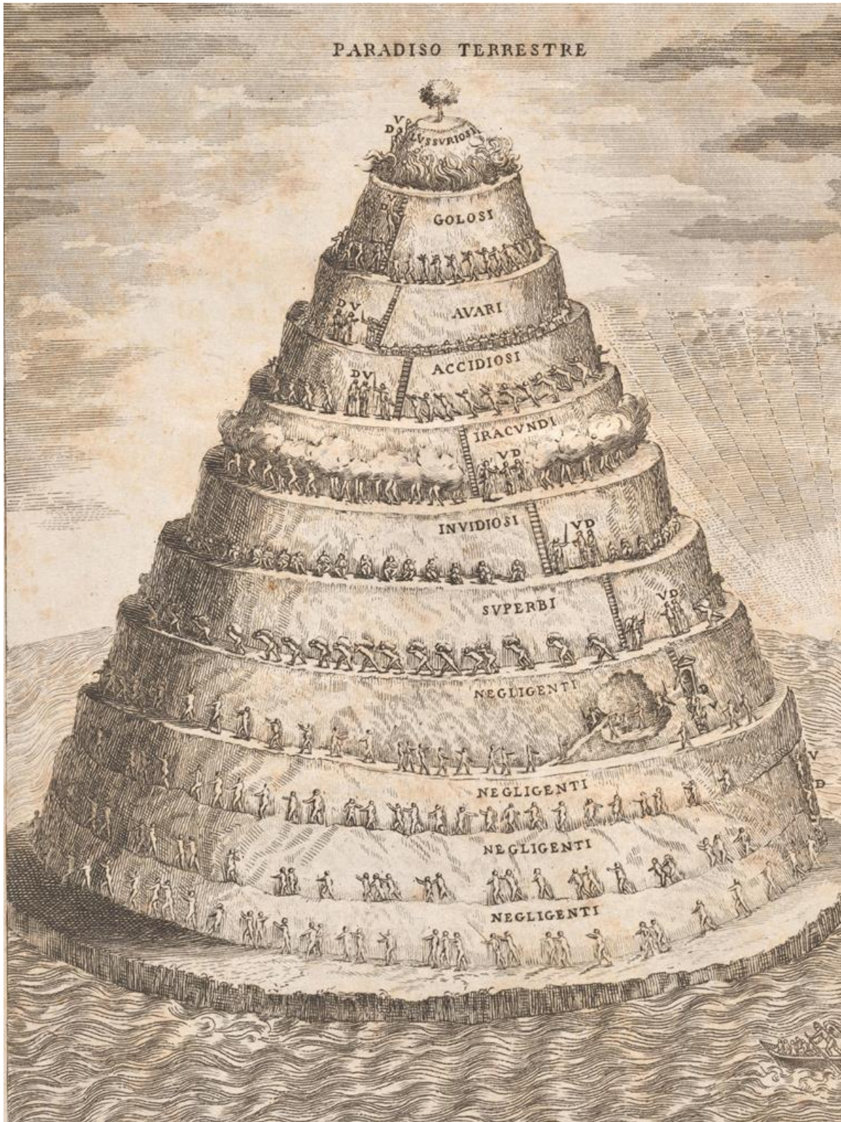
Sante Pacini, illustrazione del purgatorio, in La Divina Commedia di Dante Alighieri , novamente corretta spiegata e difesa da F.B.L.M.C., Cantica II, Roma, Antonio Fulgoni, 1791.